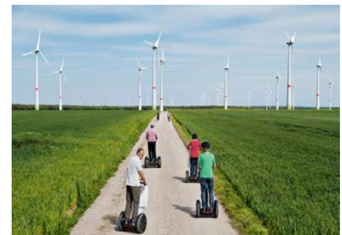
Parcs eòlics a Alemanya